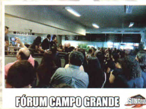
FÓRUM CAMPO GRANDE SINDIUS